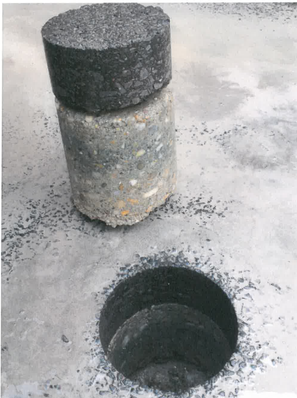
1. kép: Fúrást követően Nyíregyháza, Nyár utca 1. szám előtt tengelytől 2,0 m

Rétegfelépítés: 26 mm aszfaltbeton kopóréteg (11 mm szemnagyság) 57 mm aszfaltbeton (16-22 mm szemnagyság) kb. 165-170 mm kavicsbeton alapréteg Homokos-kavics védőréteg