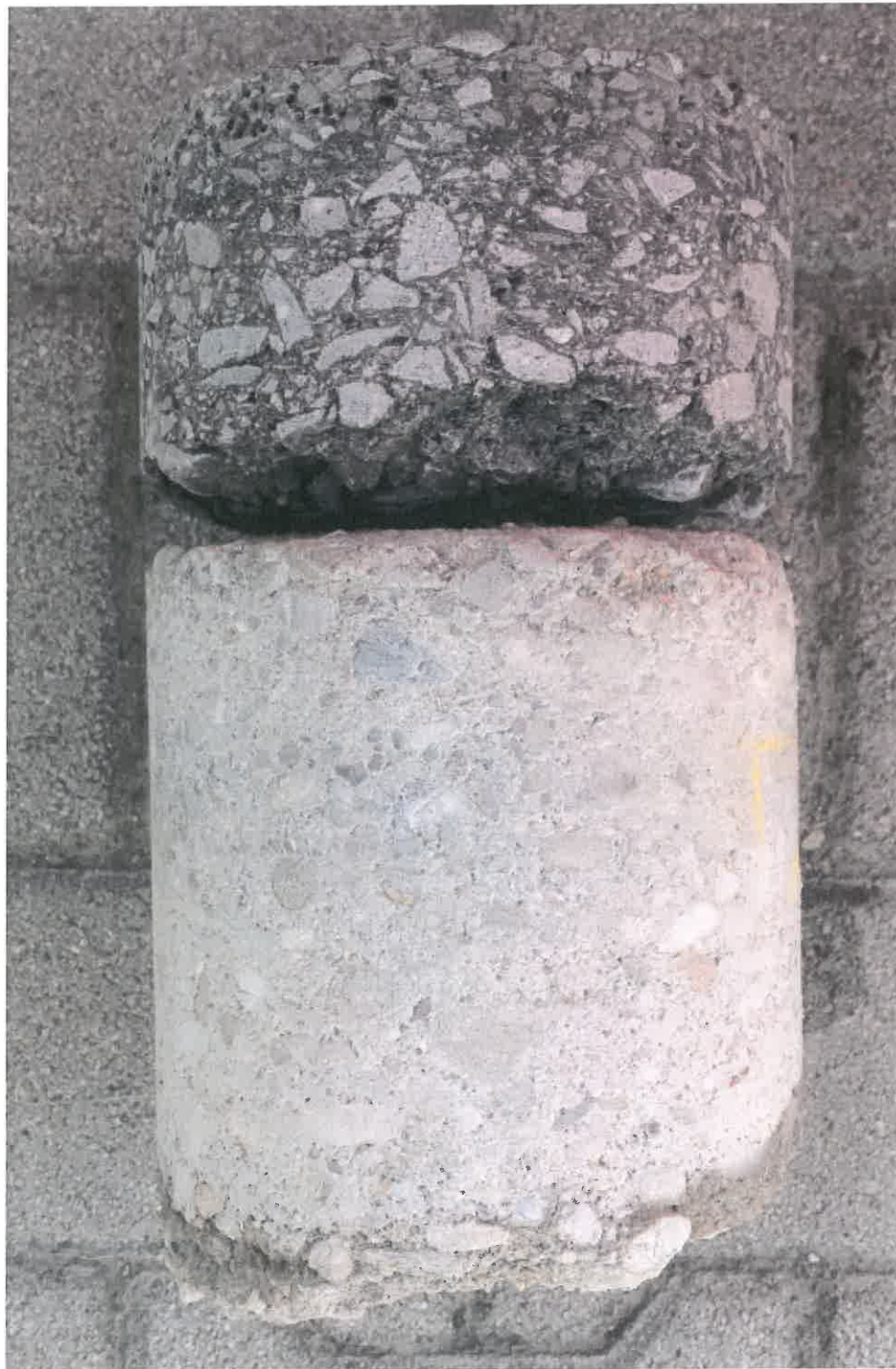
2. kép: Fúrt minta Nyíregyháza, Nyár utca 1. szám előtt tengelytől 2,0 m